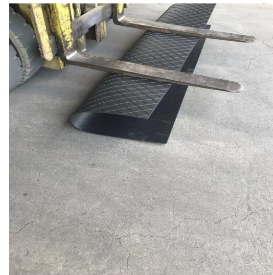
曲げにも強くコンパクトに 運搬できます。