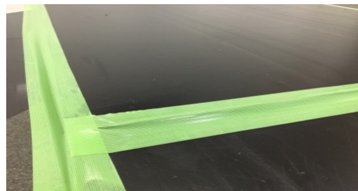
重なり部分の段差も養生テープ を貼れば気になりません。