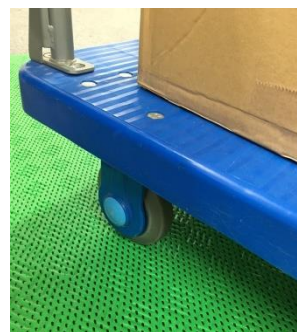
重い台車の車輪も沈むことなくスムーズに走行できます。